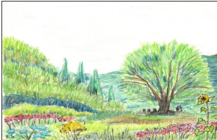
明川「郷土資料館」からの眺め